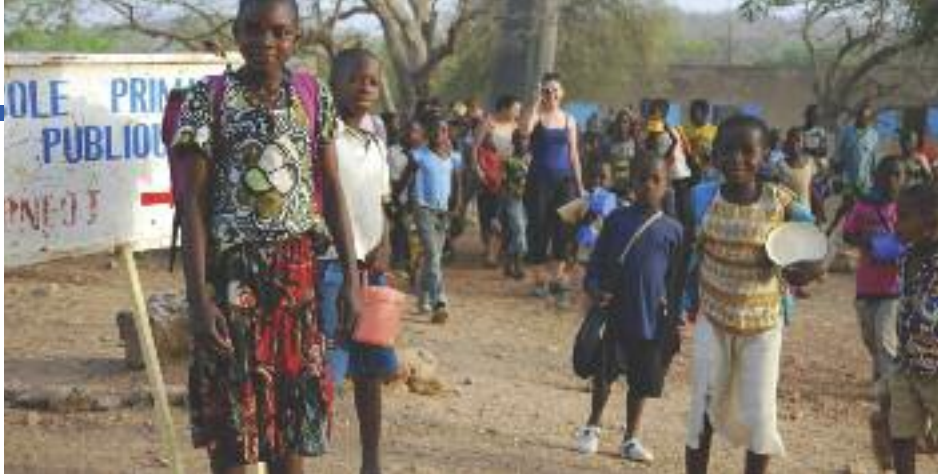
L'association L'arbre à palabres a trouvé des parrains à 48 enfants du village de Songo, au Burkina Faso, ce qui permet ainsi à ces derniers d'être scolarisés.

Fin novembre, 1,5 m 3 de fournitures scolaires et d'habillement, rassemblés par l'association dammarienne L'arbre à palabres, ont pris la direction de Songo, un petit village du Burkina Faso.