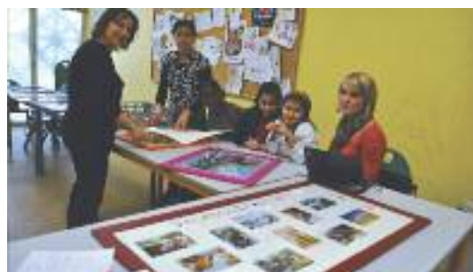
Quelques familles en pleine préparation de l'exposition sur leurs souvenirs de vacances.

Le projet « Vacances Familles » propose, depuis 2011, d'accompagner les familles dans leur projet de vacances en France en facilitant leurs démarches et l'accès aux dispositifs tel que le VACAF, un dispositif d'aides aux vacances familiales de la Caisse d'Allocations Familiales (Caf). Il est né du partenariat entre le CCAS qui regroupe l'Action sociale, l'Équipe de Réussite Éducative et le CSE, ainsi que le Conseil Général (CG), la Caf et