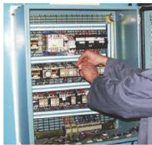
Entre 170 et 180 élèves sont accueillis chaque année dans la filière électrotechnique du lycée Joliot-Curie.

forum pour échanger des conseils ou encore des informations sur les formations dans le secteur. Il y a même des schémas détaillés de branchement ou de démarrage d'un circuit électrique pour faciliter la compréhension aux élèves et aux particuliers. « Nous prévoyons également de mettre des vidéos en ligne montrant des tests de tension ainsi qu'un livre d'électrotechnique, davantage destiné aux particuliers. »