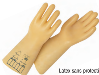
Latex sans protection mécanique