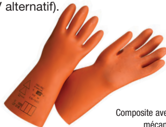
Composite avec protection mécanique